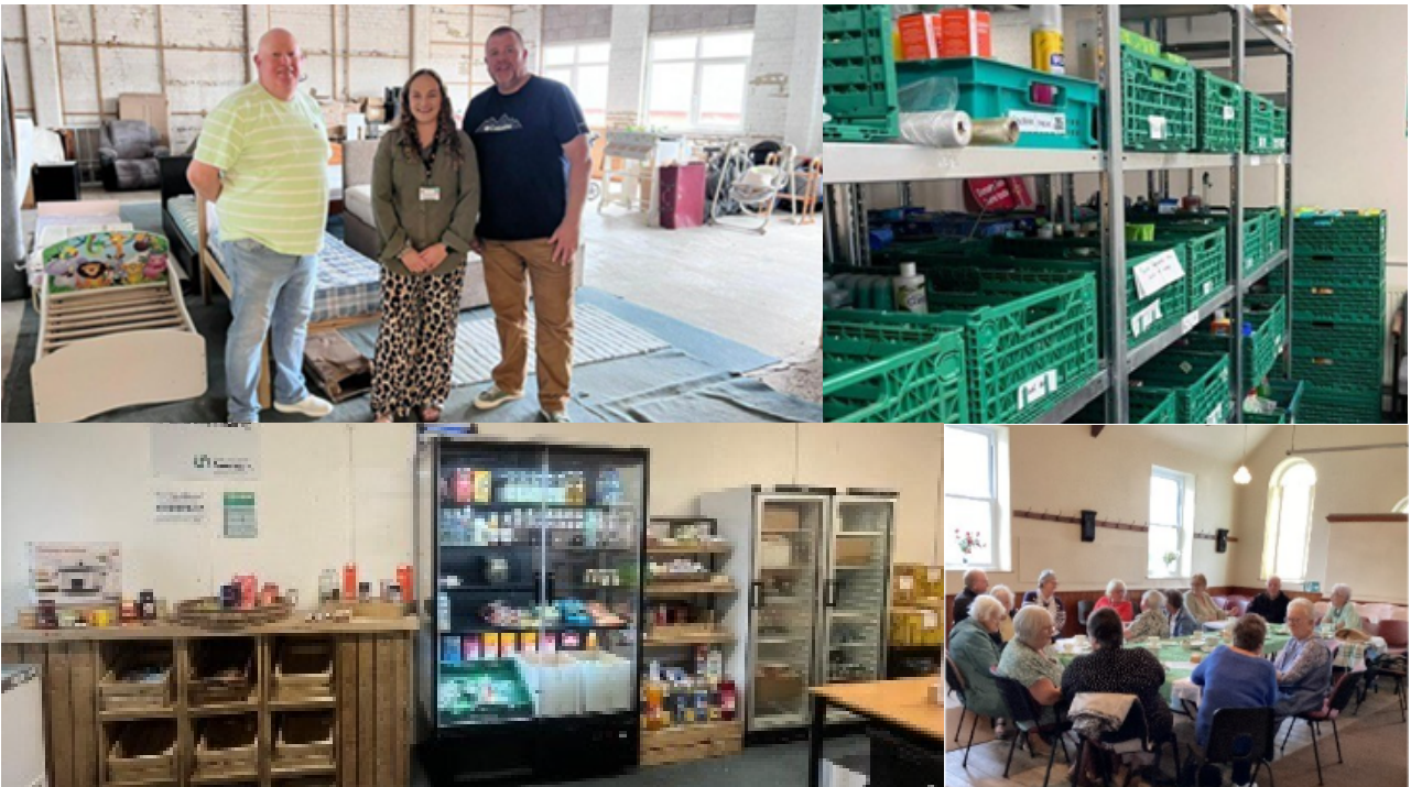
Cynlluniau bwyd amrywiol ar draws y sir, a ddarperir gan bartneriaid.

Dosbarthwyd tua 26,400 o becynnau bwyd gan sicrhau cymorth brys a hanfodol i filoedd o aelwydydd ar adeg o bwysau ariannol.